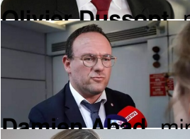
Damien Abad , ministre des Solidarités, de l'Autonomie et des Personnes handicapées ;