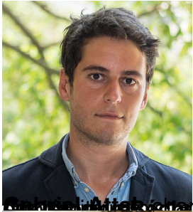
Christophe Beaugrand, ministre de la Transition écologique et de la Cohésion