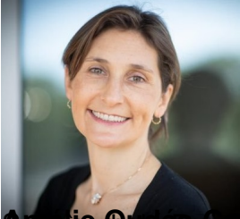
Amélie Oudot, ministre des Sports et des Jeux olympiques et paralympiques.