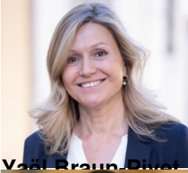
Voël Braun-Divet, ministre des Outre-mer ;