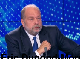
Eric Dupond-Moretti , garde des Sceaux, ministre de la Justice ;