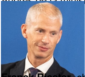
Franck Riester, chargé du Commerce extérieur et de l'Attractivité.