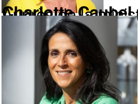
Elisabeth Borne, ministre de l'Économie, des Finances et de la Revitalisation des territoires, avec ce membre des membres