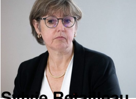
Sylvie Retailleau , ministre de l'Enseignement supérieur et de la Recherche ;