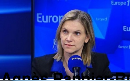
Anne Bernadette Brochen, ministre de la Transition énergétique ;