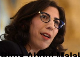
Aurélie Lhuillier, ministre de la Culture ;