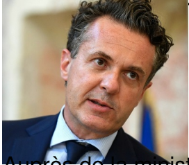
Stéphane Séjourné, ministre de l'Europe et des Affaires étrangères :