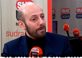
Christophe Guilloteau, ministre de la Transformation et de la Fonction publiques ;