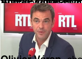
Olivier Véran, chargé des Relations avec le Parlement et de la Vie démocratique;