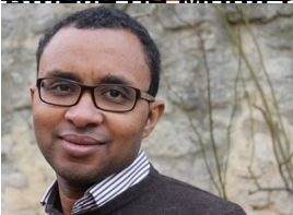
Patrice Lamy , ministre de l'Éducation nationale et de la Jeunesse ;