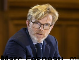
Marc Ferracci, ministre de l'Agriculture et de la Souveraineté alimentaire ;