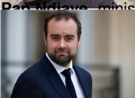
Sébastien Lecornu , ministre des Armées ;