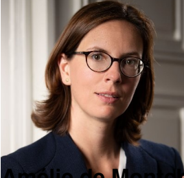
Amélie de Montmalin , ministre de la Transition écologique et de la Cohésion des territoires ;