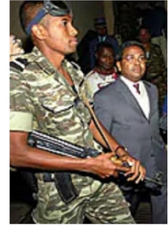
Le Premier ministre, l'ancien adversaire des tontons