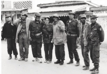
Zanadambo de 2002

dû être maîtrisé par les forces de sécurité après avoir essayé de s'échapper. Amnesty International était alors préoccupée par le fait que l'enquête ait été menée par la police, sans aucune garantie d'indépendance et d'impartialité, par le fait qu'aucun membre des forces de sécurité n'a été suspendu durant le temps de l'enquête et parce qu'aucun témoin, à part les forces de sécurité, ne semble avoir été interrogé. Selon les rapports, l'enquête est toujours ouverte.