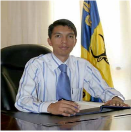
Le Maire élu, Andry Rajoelina, dans son bureau de la Commune urbaine d'Antananarivo, sis, en 2007, à Tsimbazaza, à côté de la Préfecture de Police