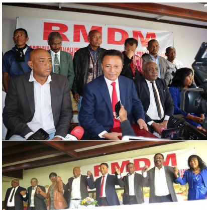
Marc Ravalomanana et ses alliés occasionnels du MRDM, sans base ni idéologie ni projet de société mais uniquement guidés par la haine et la jalousie envers le Président Andry Rajoelina. Certains de ces personnages ont été candidats à l'élection présidentielle de 2018, financièrement aidés par des Russes...

mais Ravalolo s'est fait des idées AVANT les élections qu'il a toutes perdu.