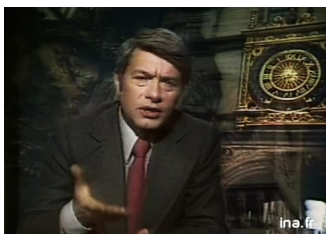
Le 23 mars 1976 sur TF1, Roger Gicquel (1933-2010), journaliste présentateur du journal télévisé de 20 heures annonce l'heure d'été. Il était alors sceptique...

« En France, on n'a pas de pétrole mais on a des idées ». C'est un slogan publicitaire de 1976 sorti durant la crise pétrolière à l'époque. Les prix du brut avaient alors atteint des sommets. Cette phrase a une suite : « c'est notre richesse et notre façon de vivre qui est menacée ». Elle était adressée aux Français qui avaient alors le devoir de sauvegarder leur souveraineté « en faisant la chasse au gaspillage ». Et c'est ainsi que, le 26 mars 1976, la France a commencé à utiliser l'heure d'été (-1h sur Madagascar en mars) et l'heure d'hiver (-2h sur Madagascar en octobre) décidés par le Président Valéry Giscard d'Estaing.