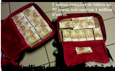
2 valises remplies de billets de 50 euros, soit environ 1 million d'euros

Travelling with €10 000 or more? No problem – make sure you declare it to customs before entering or leaving the EU.