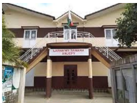
L'hôtel de ville d'Anjepy de nos jours