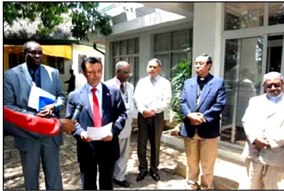
Lundi 09 mars 2009, Marc Ravalomanana s'est pointé au « Hintsy », sis à Ambohimananabola, sur l'invitation du FFKM, en présence du représentant de l'ONU à Madagascar, mais sans le Maire Andry Rajoelina, venu sur le même lieu, le 25 février 2009. Ah, l'orgueil...