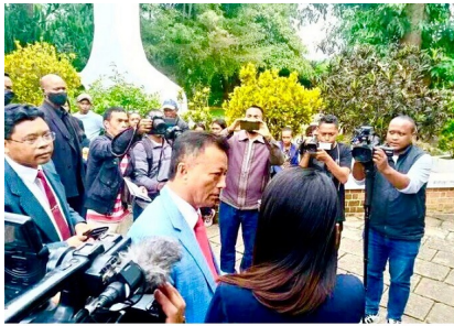
"Le Hintsy", 23 mars 2023. Marc Ravalomanana cerné par les journalistes

Si ces politocards tragi-comiques montent sur leurs grands chevaux à propos de mon titre c'est qu'ils ne se cultivent pas assez, au point de devenir amnésiques sur leur conduite du pays. Pour le grand savant Albert Einstein, qui a démontré la théorie de la relativité : « La folie, c'est de faire toujours la même chose et de s'attendre à un résultat différent » .