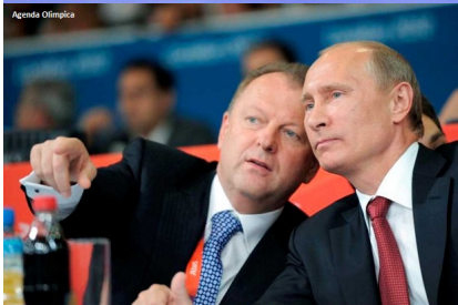
Marius Vizer et le Président Vladimir Poutine vraiment très proches...

https://www.letemps.ch/monde/russie-secretement-depense-300-millions-dollars-pour-politique-pays-etrangers