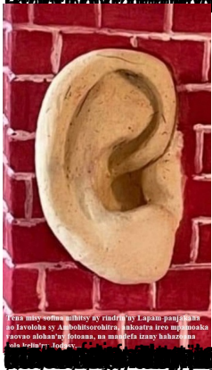
Fasa nasany vovomana mihitsy ny rindrina ny Lapsa panjambina na zavoloha ny a. mamboninahitra. mihitsy azy mba momba faovana alohan'ny fotoana, na mampifafa izany habibazana oha hafa. Toa ny...