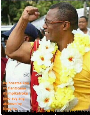
Be hozatsa koa ny fiantsoana tsy mpikatroka joko avy any atsimon'ny Noay Ity.