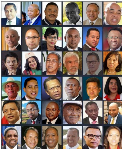
Ankoatr'i Mailhol, iza ny fito ambiny nandray sy nihinana ny volan'ny Rosiana tamin'ny fifidianana filohampirenena 2018 ?

Tsy fantatro intsony hoe iza no mampalaheho indrindra : ny firenena ve sa ny vahoaka malagasy sa i Siteny tenany mihitsy, mihevitra fa « zavatra » ? Araho ary ny tantara.