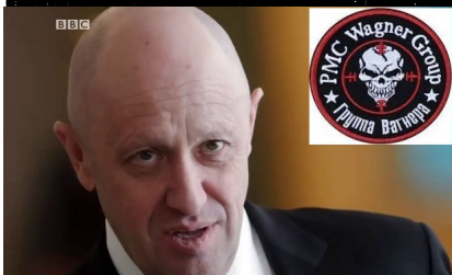
Evgueni Viktorovitch Prigojine, 62 taona, nanangana ny vondrona Wagner, ny taona