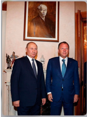
Ny Filoha rosiana, Vladimir Poutine sy Marius Vizer rainy, tany