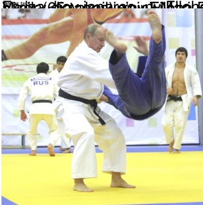
Vladimir Poutine, en 2010, à saint-Pétersbourg. Depuis, il a passé son de.