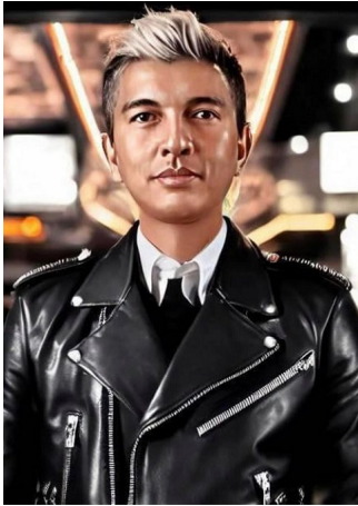
Ny Filoha Andry Rajoelina, araka ny fijerin'ny sasany azy mba