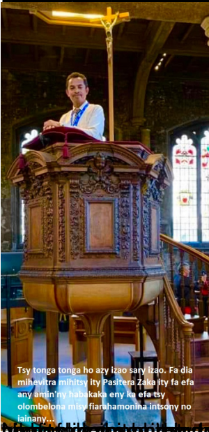
Tsy tonga tonga ho azy izao sary izao. Fa dia mihevitra mihiitsy ity Pasitera Zaka ity fa efa any amin'ny habakaka eny ka efa tsy olombelona misy fiarahamonina intsony no iainany...