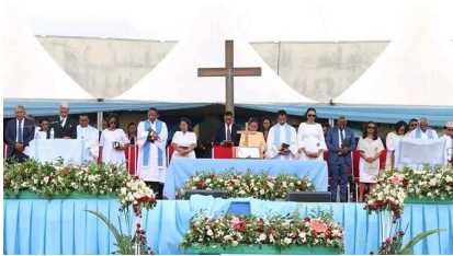
Coliseum, Antsonjombe, Alahady 15 Janoary 2023. Tso-drano nivedika fahamelezana ara-politika. Misaotra Zaka a!

Inona ry zareo ny zavatra tsy hitranga eto ambonin'ity tany fandalovana ity ? Izaho aloha dia tsy ho gaga intsony n'inona n'inona hiseho. 69 taona aho izao. Raha mbola homen'Andriamanitra 25 taona hiainana eto an-tany aho dia mba hahita ny zafiafy sy ny zafikitrokely. Fahasoavana be izany. Saingy faniriana ny an-draolombelona fa lzy irery ihany no manapaka.