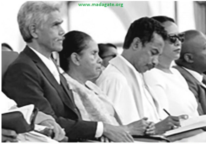
Coliseum Antsonjombe, Alahady 15 Janoary 2023. Ny Pasitera Ammi Irako Andriamahazosoa sy Zaka Hary Misy Andriamampianina sy ireo vadiny. Nikatoka mafy mihitsy ity farany hamelezana mafy na mpitondra, na mpitandro filaminana. Diso palka tanteraka, indrisy...