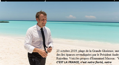
23 octobre 2019, plage de la Grande Glorieuse, une des îles éparpillées revendiquées par le Président Andry Rajoelina. Voici les propos d'Emmanuel Macron : "ICI C'EST LA FRANCE, c'est notre fierté, notre richesse. Ce n'est pas une idée creuse (...)"

LES « ILES PARSES » DE L'OcéAN INDIEN ET DU CANAL DU MOZAMBIQUE