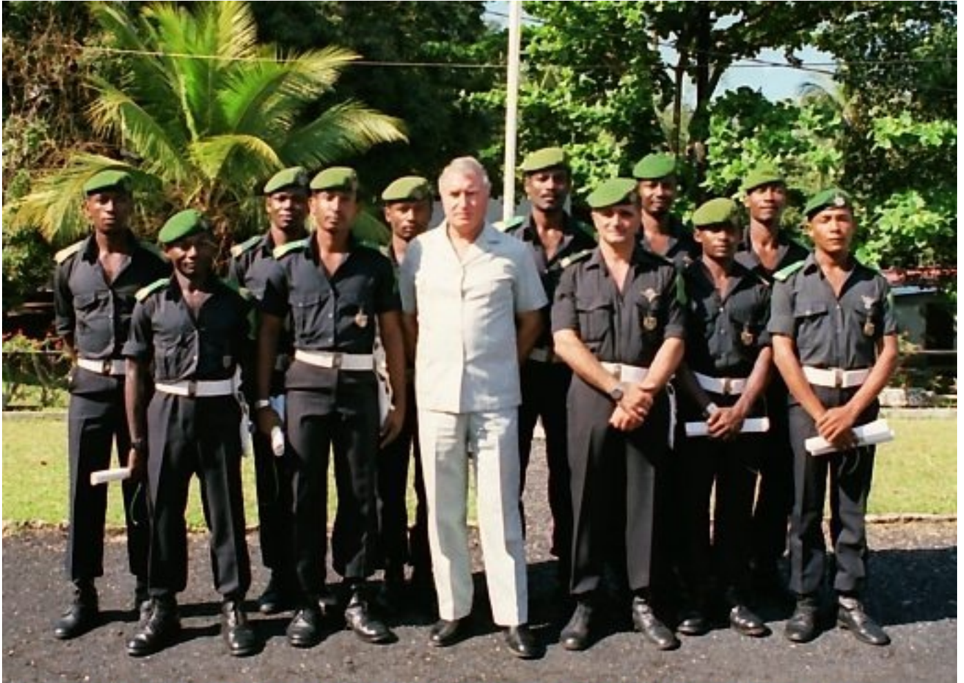
Au centre, Bob Denard, alors surnommé "le Sultan blanc des Comores"