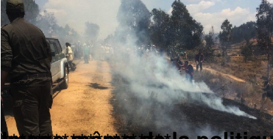
image même de la politique de la terre brûlée... Mais ce n'est que partie remise