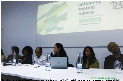
antson'ny tontolo miaina Zone Zitéi (à côté du magasin Bébé à bord) du 20 mai au 5 juin Horaires : du lundi au samedi de 11h à 18h30 Dimanche, lundi de pentecôte (29 mai) de 10h à 13h Tel : +261 32 94 099 57 www.madagat.org