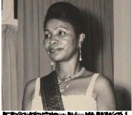
Le Wednesday Morning Group Madagascar est une association à but non lucratif qui a pour objectif de