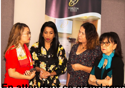
En attendant de vous rencontrer, rendez-vous c'est quoi exactement WMG Madagascar ?