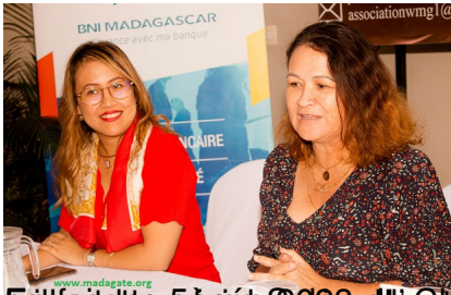
Présidente du BNI Madagascar et Présidente de l'Association Wednesday Morning Group Madagascar