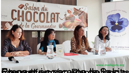
Présidente de BNI Madagascar et Présidente de l'Association Wednesday Morning Group Madagascar