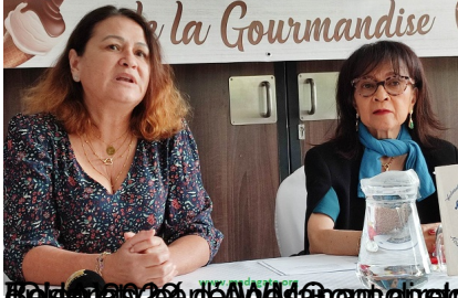
Présidente de l'Association Wednesday Morning Group Madagascar et Présidente de BNI Madagascar