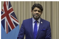
M. Aiyaz Sayed-Khaiyum, Premier ministre par intérim des Fidji

S'exprimant depuis un pays insulaire qui a été frappé par 14 cyclones depuis 2016, M. Aiyaz Sayed-Khaiyum