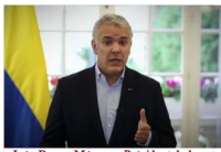
Iván Duque Márquez, Président de la Colombie

« □ L'agriculture emploie deux tiers des personnes en Afrique subsaharienne et représente près d'un tiers du PIB. Pourtant, les petits producteurs ruraux sont systématiquement sous-financés – et c'est encore plus vrai depuis la pandémie. □ L'occasion est donnée au secteur privé conscient de ses responsabilités d'innover et de contribuer à combler le déficit mondial de financement de 170 milliards de dollars, afin d'aider les petits producteurs à accéder au crédit et aux marchés ».