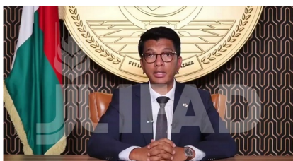
Le Président de la République de Madagascar, Andry Rajoelina

, les dirigeants mondiaux ont appelé à investir de manière urgente et innovante pour aider les communautés rurales des pays les plus pauvres du monde à s'adapter aux changements climatiques. S'exprimant à l'ouverture de la 45 e session annuelle du Conseil des gouverneurs à laquelle ont participé 177 États membres du Fonds international de développement agricole (FIDA) des Nations Unies, les dirigeants ont explicitement souligné la vulnérabilité des petits producteurs agricoles aux événements météorologiques violents, comme les tempêtes qui ont dévasté Madagascar ces dernières semaines, tuant au moins 121 personnes et détruisant plus de 176.000 hectares de terre