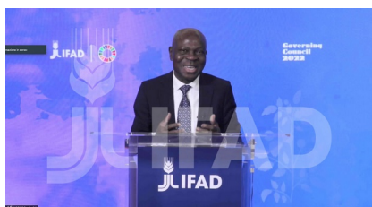
Le Président du FIDA, M. Gilbert F. Houngbo