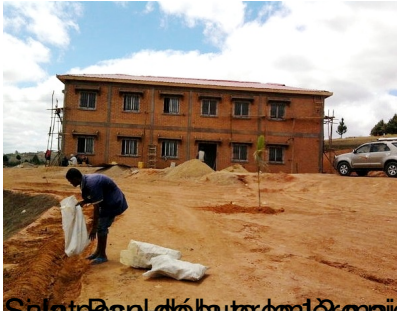
Le 30 avril, la construction de ce qui sera l'Orphelinat