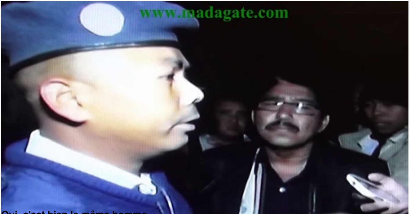
Qui, c'est bien le même homme