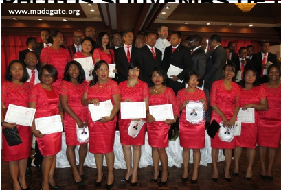
PHOTOS SUIVANTES DE LA 12ème PROMOTION BLAISE RABETAFIKA DU CEDS