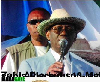
Meux chapeau de paille ("satroka penjy") au début des années 1990,