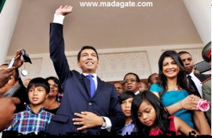
Ministre de l'Int rieur, M. Ramanantsoa Rakotonirainy, lors de la c l bration de