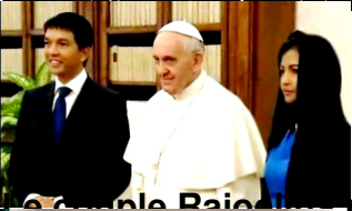
Le couple Raibe re u par le Pape Fran ois au Vatican