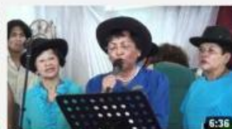
Dames Malgaches Clubs 10 8 mars 2012