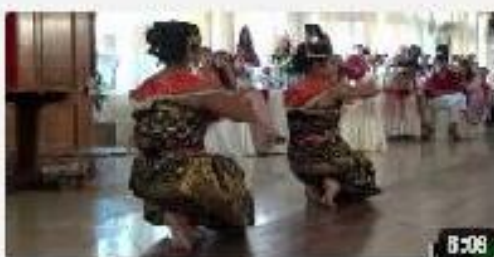
Dames Malgaches Clubs 14 8 mars 2012