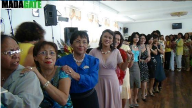
Madagascar: Ces Dames malgaches des Clubs de service fêtent le 8 mars 2012 à leur manière