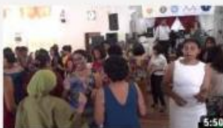
Dames Malgaches Clubs 08 8 mars 2012