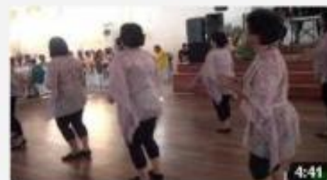
Dames Malgaches Clubs 13 8 mars 2012

VOUS POUVEZ VISIONNER TOUTES LES VIDEOS EN ALLANT SUR : www.youtube.com/papizano100