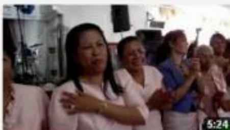
Dames Malgaches Clubs 12 8 mars 2012