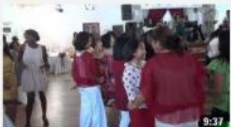
Dames Malgaches Clubs 11 8 mars 2012