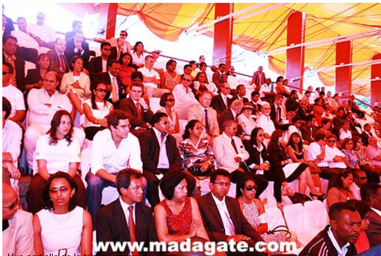
Vue partielle de la tribune centrale