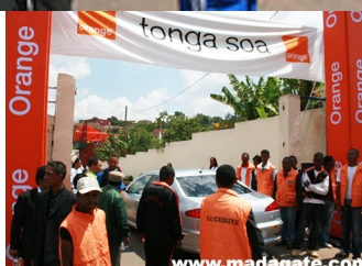
Entrée du stade aux couleurs orange