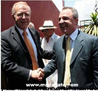
Président de l'Union des Télécommunications (U.T.) Jean Luc Bohé d'Orange