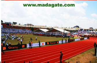
Un public sage et discipliné car la sécurité était renforcée