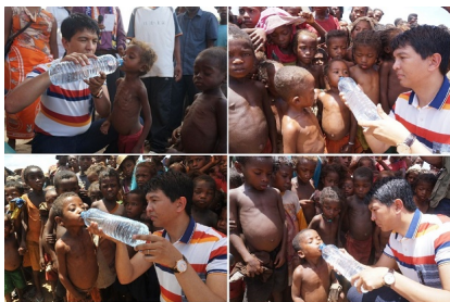
Le citoyen Andry Rajoelina, le 7 février 2016, dans le Sud de Madagascar

. Ceux qui s'opposent à eux ou mettent en doute leur rationalité courent le risque d'être psychologiquement excommuniés, intellectuellement discrédités et socialement persécutés.