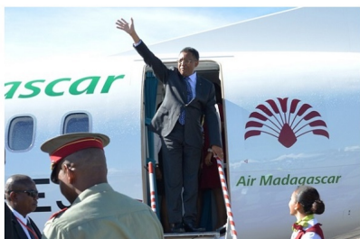
Plus de 30 voyages à l'étranger aux frais des contribuables gogos impénitents malgaches en deux ans de pouvoir

C'est la commune d'Anjapay, dans le district de Tsihombe qui avait été la plus touchée par le Kere, cette année 2016. La réaction du président Hery Rajaonarimampianina, a été tout simplement inqualifiable. Un jour après le citoyen Andry Rajoelina, il est allé, à son tour, dans le Sud, espérant effacer les traces de son ancien patron.