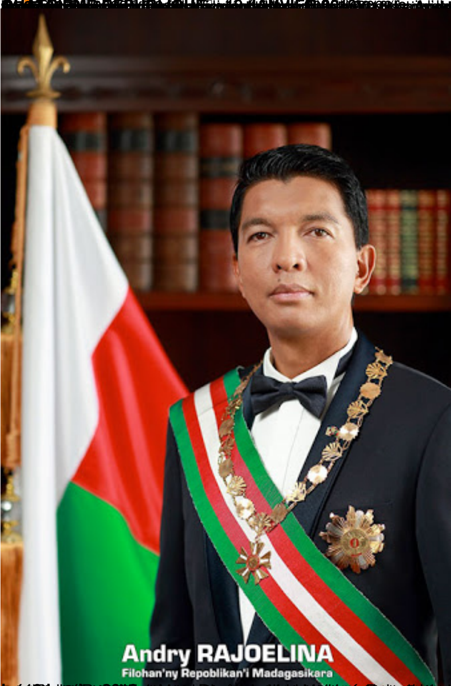
Andry RAJOELINA Filohan'ny Repoblikan'i Madagasikara