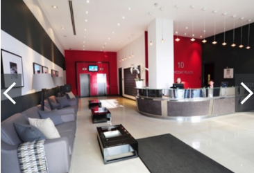
Le hall commun à tous les locataires