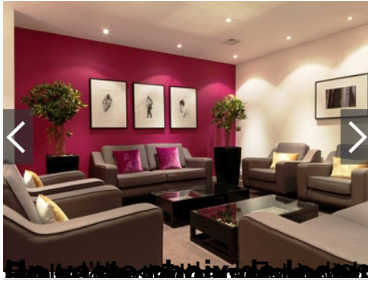
UK-Madagascar Trade & Investment Forum 6th September 2017, Central London

Mercredi, 06 Septembre 2017 02:55 - Mis à jour Mercredi, 06 Septembre 2017 18:40