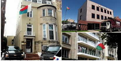
Ambassades de Madagascar aux Etats-Unis, au Canada et en France

sur cette réouverture de l'ambassade de Madagascar. Ce, pour que le président Hery Rajaonarimampianina évite de s'embarquer dans un nouveau mensonge au peuple malgache qui paie tous ses voyages.