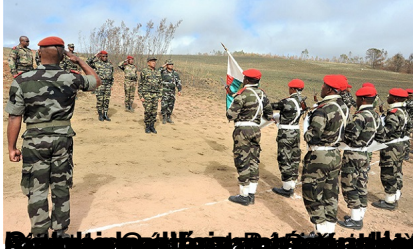
Le commando Hvm à Antsiranana, le 22 août 2017.