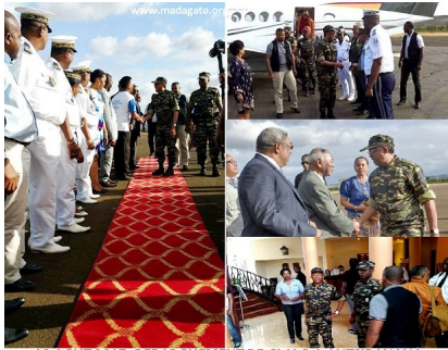
18 AOÛT 2017. DEBARQUEMENT DE GI JAO À ANTSIRANANA