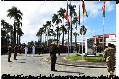
Le commando Hvm à Antsiranana, le 22 août 2017.