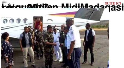
Always Madagascar Airways...