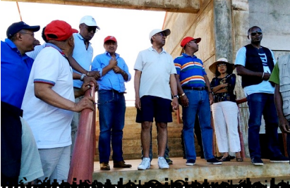
Le commando Hvm à Antsiranana. Mais où diable était donc G.I. VoaJane la catholique?