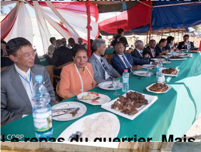
Le repas du guerrier. Mais où diable était donc G.I. VoaJane la catholique?