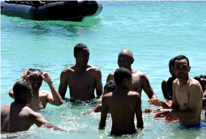
Le repos du guerrier très entouré