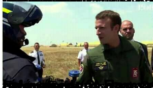
Le commando Hvm à Antsiranana, le 22 août 2017.