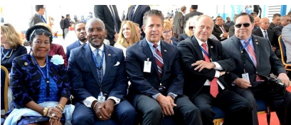
From left to right: Sheila Jackson Lee (US Representative, Democrat, Texas); Greg Meeks, US representative, Democrat, New York); Mike Bishop, US Representative, Missouri); ; Steven King (US Representative, Democrat, Iowa) Blake Farenhold, US Representative, Democrat, Texas)

Tsy adino ny fanajàna ny atao hoe Demokrasia.