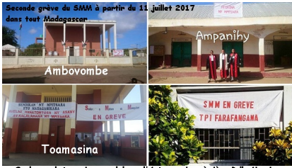
Quelques photos prises en dehors d'Antananarivo où siège Rolly Mercia