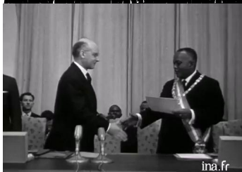
Président de la République, le Général de Gaulle, reçoit à Paris le 14 octobre 1958, le Président de l'Assemblée provinciale de Madagascar, le Général de Gaulle, et le 14 octobre 1958.

Le Congrès des Assemblées provinciales de Madagascar, réuni à Tananarive le 14 octobre 1958, sur convocation faite par arrêté n° 1.166 du 8 octobre 1958;