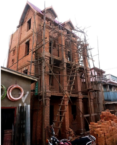
Maisons de Vohangy Rajoanainampianina en construction du côté du barrage de Tsiacompany, en avril 2016