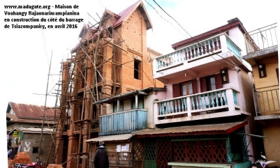
Maisons de Vohangy Rajoanainampianina en construction du côté du barrage de Tsiacompany, en avril 2016