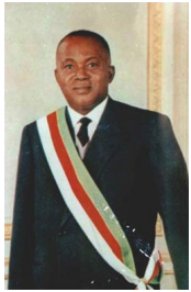
Le Président Philibert Tsiranana

Le 30 janvier 1972, M. Tsiranana est réélu avec près de 98% des voix... En cette année 1972, la population totale de Madagascar est de 7.900.000 habitants dont 360.000 concentrés à Antananarivo, dont 100.000 étrangers (3.000 indo-pakistanaïses et chinois, 43.500 comoriens de nationalité française et 31.000 français dont 20.000 résidant dans la capitale). A cette époque de la centralisation à outrance, la seule université de Madagascar, baptisée « Charles de Gaulle », sise à Ankatso, compte 5.000 étudiants. Durant le calme cité plus haut, cependant, les déçus de ce pouvoir, dont l'organe de presse était le journal