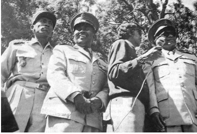
Photo : De gauche à droite: le Colonel Richard Ratsimandrava , assassiné le 11 février 1975 -alors qu'il avait reçu les pleins pouvoirs du Général Ramanantsoa, deux jours auparavant- ; le Général Gilles Andriamahazo , futur président du Directoire militaire qui a suivi cet assassinat, le Général Gabriel Ramanantsoa (en lunettes noires) qui a reçu les pleins pouvoirs du président Philibert Tsiranana