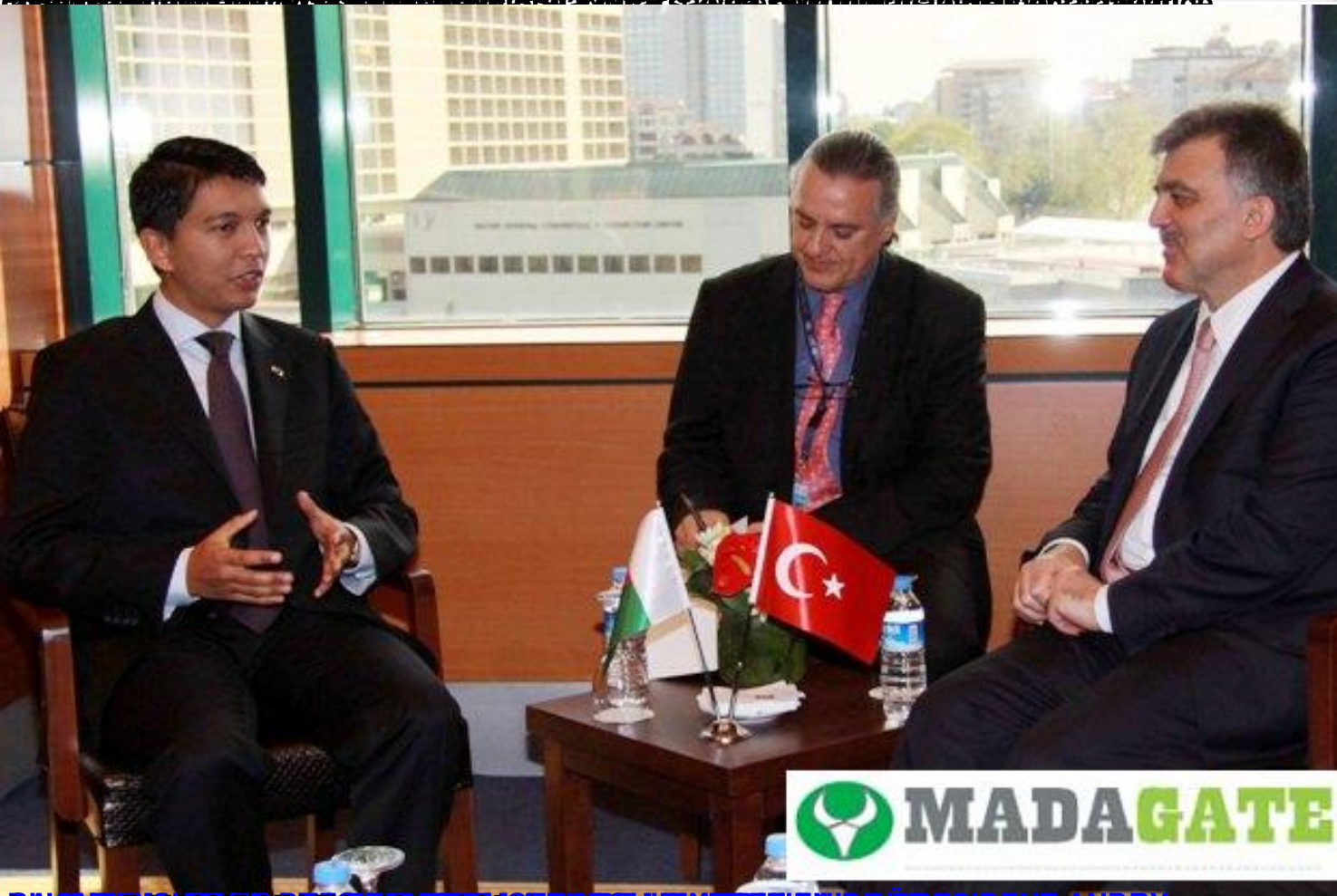
Ban Ki-Moon AMBA ZAFY 10 mai 2011 OSRULE MBUTLENDU GUE PRESIDENT ANDRY