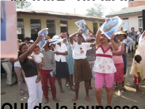
OUI de la jeunesse