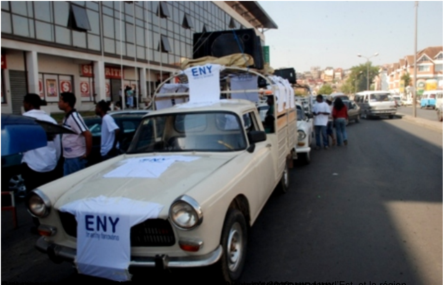
l'Est, et la région