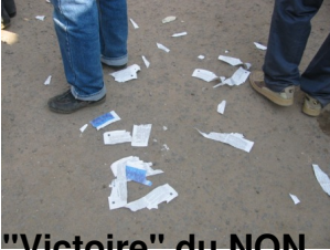
"Victoire" du NON