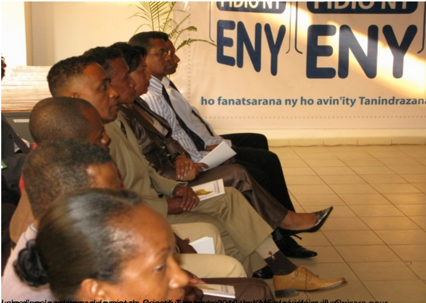
Loisadisele conference de presse, Gjestitiu octobree 2010, itan'ny KMF la révéleina ny Quirera pour