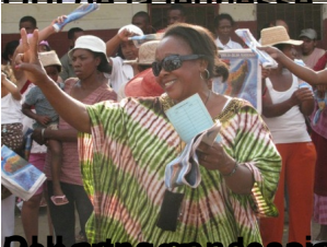
Représentants du conseil municipal de RAMAMBAZAFY