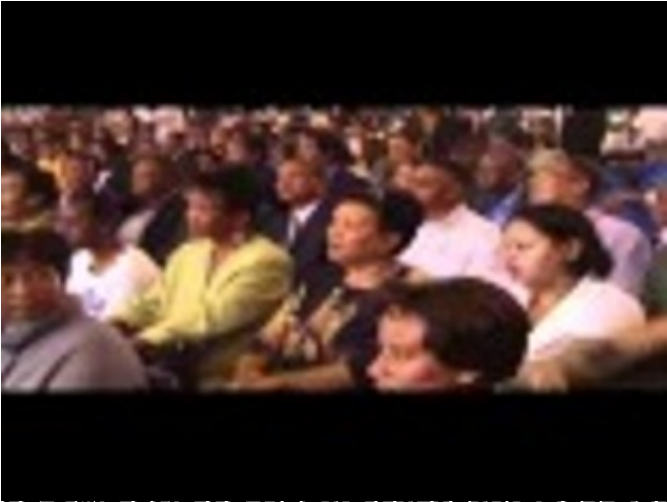
REGIONS DE MADAGASCAR