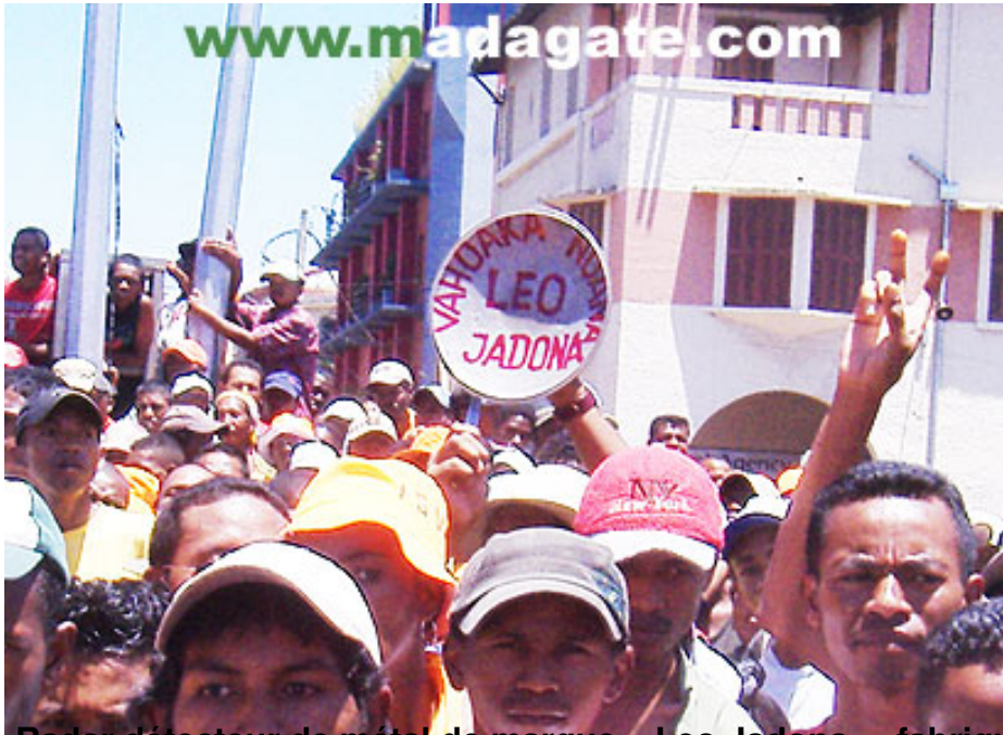
Radar détecteur de métal de marque « Leo Jadona » fabriqué à Ambatolampy