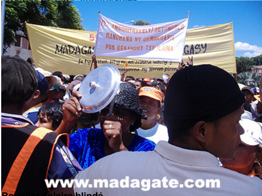
Bouclier solaire blindé