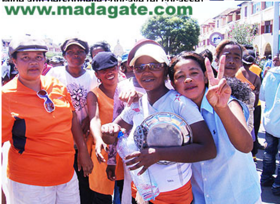
Grenades pour mourir de rires et protège poitrine ultra sophistiqué