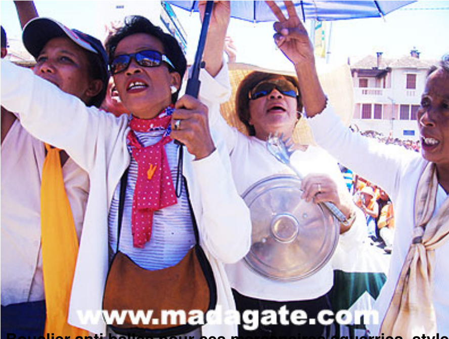
Brocheur anti-balles pour ces mères de familles style garde rapprochée de Kadhafi