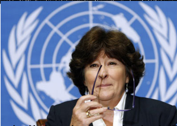
Louise Harbo, haut commissaire de l'ONU aux droits de l'homme : Article 5 : «Nul ne sera soumis à la torture»