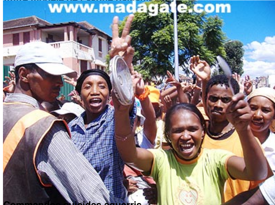
Commandos suicides aguerris