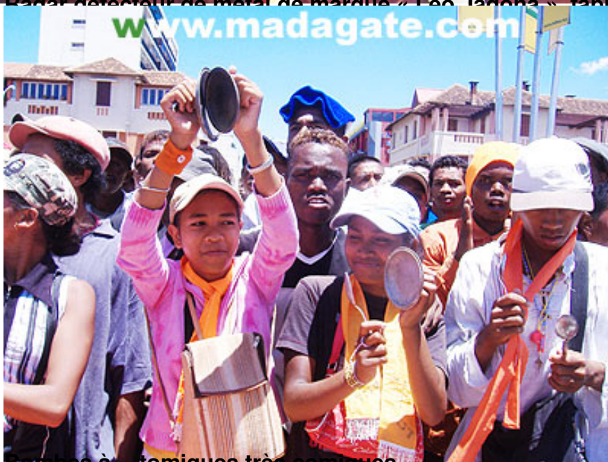
Bombes à... tomiques très comiques