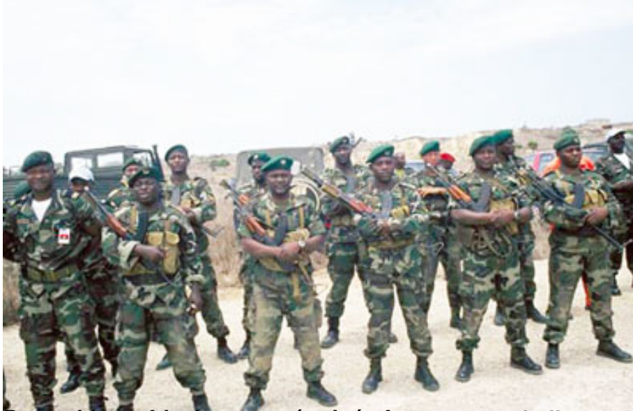
Des soldats africains sous-équipés face aux « rebelles oranges »