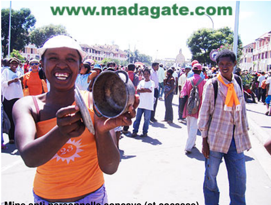
Mine anti-personnelle concave (et cocasse)