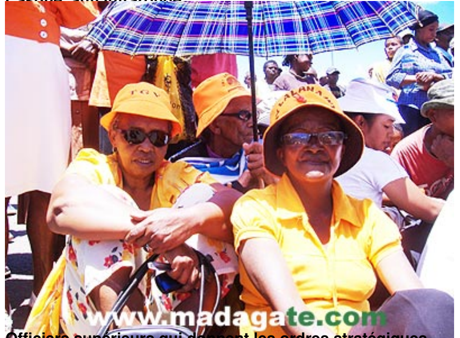
Officiers supérieurs qui donnent les ordres stratégiques