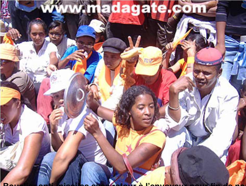
Bouclier antimissiles avec retour à l'expéditeur pour fin de non-recevoir