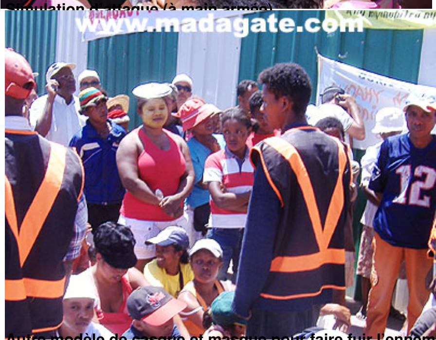
Autre modèle de casque et masque pour faire fuir l'ennemi