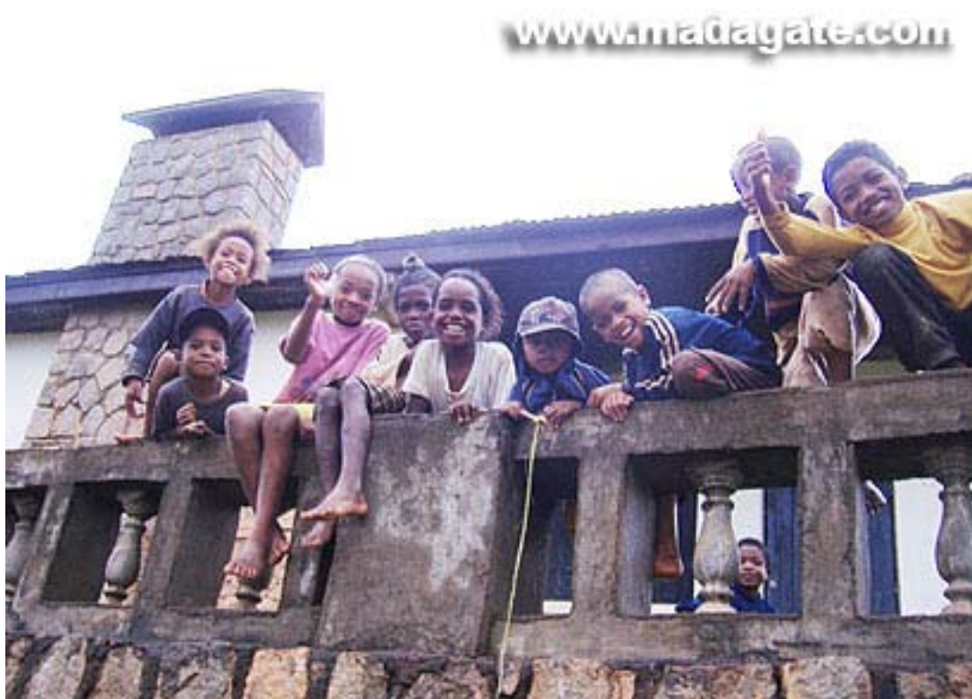
Couramment, cette photo d'enfants, prise de près, de village pauvre à Miraflores, a été utilisée