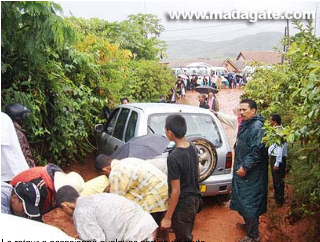
Le retour a occasionné quelques séries de suite