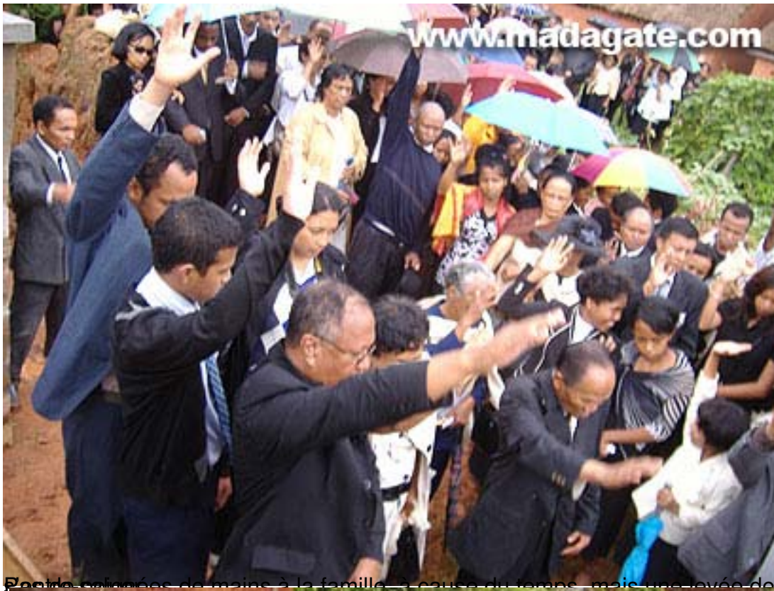
Écoute silencieuse de mains à la famille... cause du temps, mais une levée de main pour