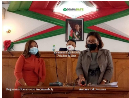
Liste définitive des candidats retenus à l'élection des représentants du Sénat pour devenir membres de la HCC durant un mandat de 7 ans