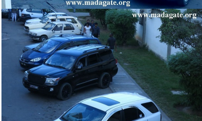
Aéroport d'Ivato, 22 Avril 2017

20h00 - Arrivée de M. M. H. à l'aéroport d'Ivato. M. H. est accompagné de son épouse et de ses deux enfants. M. H. est accompagné de son épouse et de ses deux enfants.