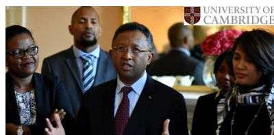
Les Rajaonarimampianina. Tourisme environnemental à Cambridge

'excuse que la liste définitive de 40 membres a été arrêtée le 20 novembre