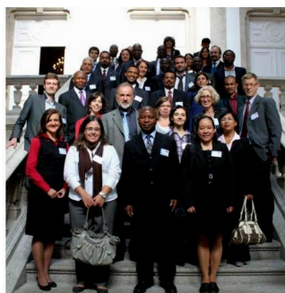
MUNDUS ACP representatives

Financé par la Commission Européenne, coordonné par l'Université de Porto et mis en œuvre par l'Agence Exécutive «Éducation, Audiovisuel et Culture» (EACEA), l'objectif principal du programme ERASMUS MUNDUS ACP est de renforcer la coopération dans le domaine de l'enseignement supérieur entre l'Union Européenne et les Pays ACP, en appuyant la mobilité la mobilité des étudiants en Master et Doctorat (des Pays ACP vers l'Europe) et la mobilité du personnel académique et administratif (dans les deux sens).