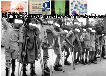
Ankizy tsy natao vaksiny fony zaza, tratry ny lefakozatra na "poliomyélite"