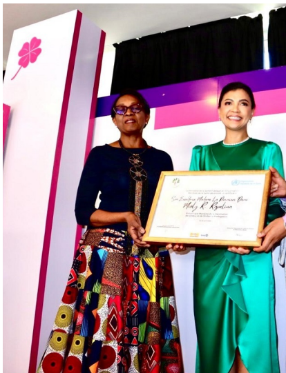
Félicitations chaleureuses, à Madame Mialy Rajoelina, Première Dame de Madagascar, pour avoir défendu les efforts visant à garantir que les enfants de tout le pays reçoivent les vaccinations essentielles. Appréciez l'initiative visant à protéger la santé des enfants, offrant ainsi à la prochaine génération la possibilité de s'épanouir ! Antananarivo, le 26 avril 2024 Dr Matshidiso Moeti Directrice Régionale de l'Organisation mondiale de la santé (OMS) pour l'Afrique

Inona no antony tokony -ary tsy maintsy- hanaovana vaksiny ny zaza malagasy ? Fanazavana nomen'ny vadin'ny Filoham-pirenena, Mialy R. Rajoelina, ny zoma 26 avrily 2024 tao Antanimenabe Ankorondrano Antananarivo. Tsihiviny fa izy dia reny mpiahy ny fanaovana vaksiny nanomboka ny taona 2019, eo ambanin'ny fiahian'ny OMS (Fikambanana maneran-tany momban'ny Fahasalamana) ary mbola notohizin'ity farany io andraikitra io noho ny fitokisany an'ny Première Dame Mialy Rajoelina.