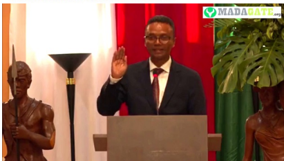
Herindrainy Olivier Rakotomalala, ministre des Mines