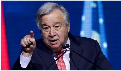
Le 2019 de l'Assemblée Générale des Nations Unies

1. L'incitation à la discrimination, à la haine, à la violence ou à la ségrégation* à l'égard d'autrui, en public, intentionnellement et pour une raison précise. 2. La diffusion d'idées fondées sur la supériorité raciale ou la haine raciale.