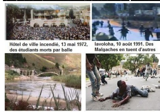
Hôtel de ville incendié, 13 mai 1972, des étudiants morts par balle / Iavoloha, 10 août 1991. Des Malgaches en tuent d'autres / Fathita. Pont dynamité dans la nuit du 28 au 29 mars 2002 / Ambohitsorohitra, 7 février 2009. Carrage sans sommation

11 candidats à la présidence de Madagascar : un créateur du Mal : Fanirisoa Ernaivo qui, le 12 septembre