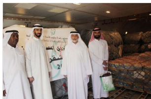
The Mohammed Bin Rashid Al Maktoum Humanitarian Charity Establishment (MHCE) has sent 96 tonnes of relief aid to Madagascar which is hit by the tropical cyclone 'Haruna'.

En mars 2013, lors des ravages faits par le cyclone Haruna , il n'y avait aucun problème en ce qui concernait les dons humanitaires venant de Dubaï. Il faut alors constater que si le BNGRC (Bureau national de gestion des risques et catastrophes) existait déjà, Hery Rajaonarimampianina, lui, n'était pas encore président de la république. Et les dons sont bien parvenus à leurs bénéficiaires, c'est-à-dire les victimes ( "tra-boina" ).