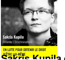
EN LUTTE POUR OBTENIR LE DROIT D'ÊTRE LUI-MÊME