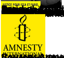
JUSTICE POUR ISSA ET FARID