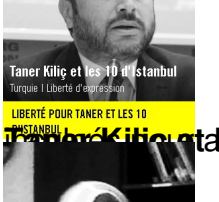
LIBERTÉ POUR TANER ET LES 10 AUTRES