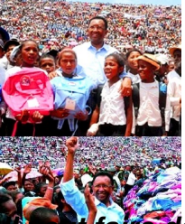
Madagascar Education: honte à vous, Monsieur Rajaonarimampianina!