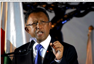
Election 2018 : Démission du président candidat Cinq mois avant le scrutin

Trump says when he sees these leaders he sees "partners" for promoting prosperity and