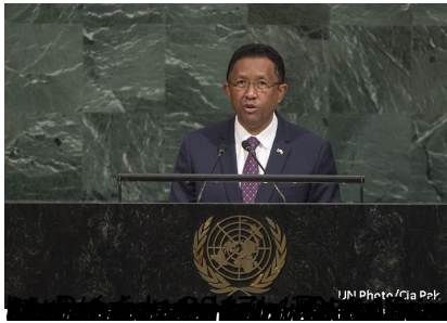
September 20, 2017 UNITED NATIONS - The Latest on President Donald Trump and Africa 2 p.m.

President Donald Trump says he's interested in boosting U.S. investment in Africa to help create jobs and opportunity on both sides of the Atlantic.