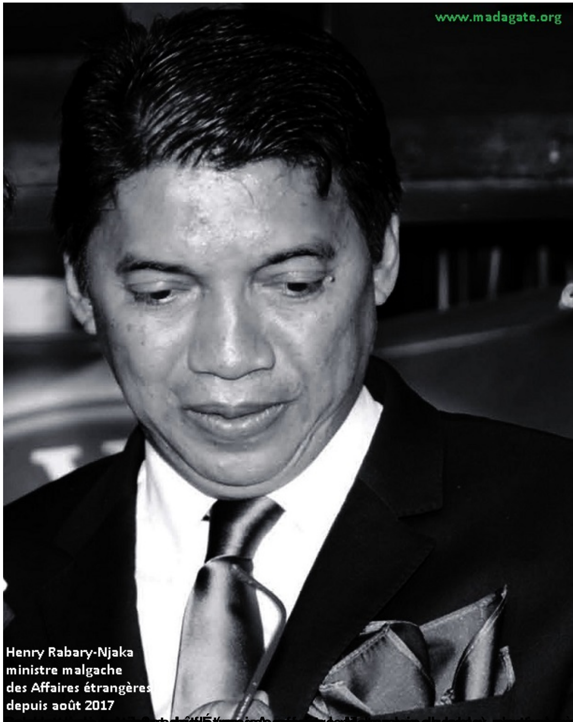
Henry Rabary-Njaka ministre malgache des Affaires étrangères depuis août 2017

Jeannot Ramambazafy (à gauche) ministre des Affaires étrangères malgache, en discussion avec le ministre malgache des Affaires étrangères, Henry Rabary-Njaka.