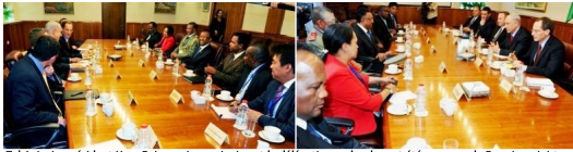
Tel Aviv. Le président Hery Rajaonarimampianina et la délégation malgache ont été reçus par le Premier ministre israélien, Benjamin Netanyahou, le dimanche 8 juin 2014.

Plus exactement, le 8 juin 2014, si l'on se réfère aux photos légendées ci-dessous.