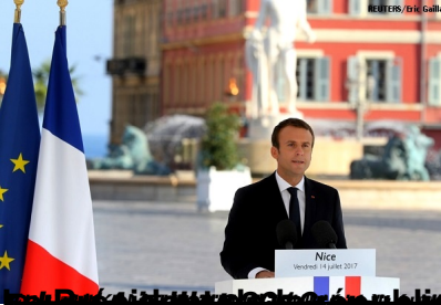
Nice Vendredi, 14 juillet 2017