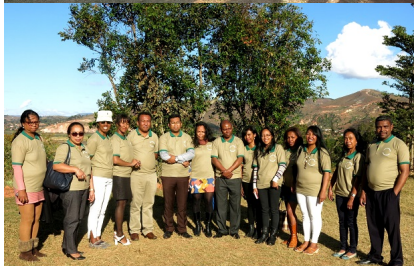
At the end of the day, on Sunday 18th June 2017, for the celebration of the 10th Anniversary of the creation of the ITEC Alumni Madagascar, we were welcomed by the staff and students of the EPP Ambohimarina, for the handover of the donations.