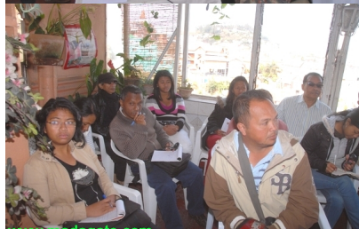
www.madagate.com (au fond à droite) de Midi Madagasikara