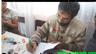
Dédicace du livre de presentation

Le livre de présentation de la Fondation pour la Démocratie et le Développement a été présenté au Palais