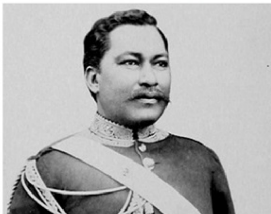
NY LOVA NAPETRAK'I RASANJY (1851-1918)

Fomba amam-panaony Mbola mitoetra mandrak'ity ny androany