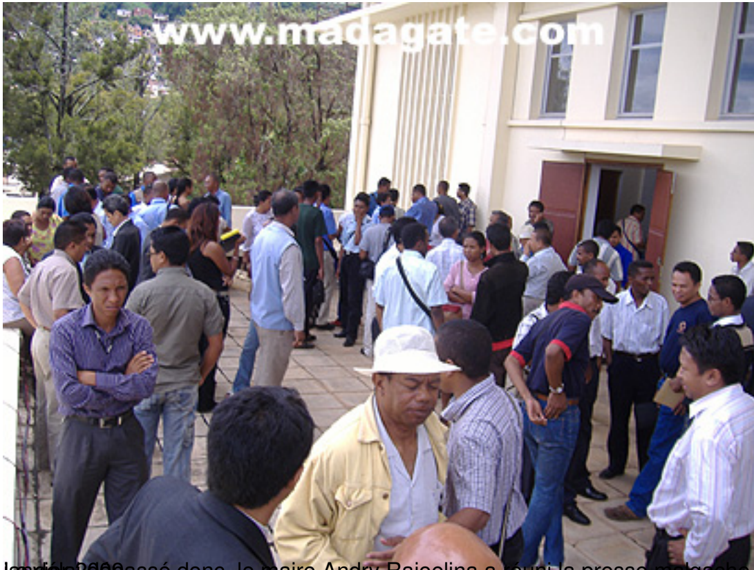
Le maire Andry Rajoelina a réuni la presse à la mairie ce matin du 14