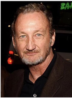
Robert Englund en 2008

Les films composant la série réalisés par Wes Craven, maitre de l'horreur, et joué par Robert Englund