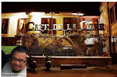
Implanté subitement avec de grands moyens financier venus d'on-ne-sait-où... par le fils aîné du président expert-comptable alors en exercice, cette "magnifique brasserie typique des années 20" ferme subitement ses portes du jour au lendemain... de la défaite de son père candidat Hery Rajaonarimampianina, lors du premier tour de l'élection présidentielle de 2018. Puis ce fils prodigue disparaît du territoire de Madagascar

. La réalité était que sous le régime de Hery Rajaonarimampianina, chaque dernier jeudi du mois le « Café de la Gare » proposait de soutenir une association malgache en mettant à disposition son café-restaurant et en reversant une partie du chiffre d'affaire hors taxe de la soirée au profit de l'association.