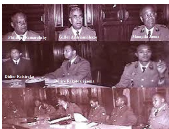
Membres du Directoire Militaire de la République de Madagascar (12 février au 15 juin 1975)

UDECMA-KMTP : candidats : 02, sièges : 02